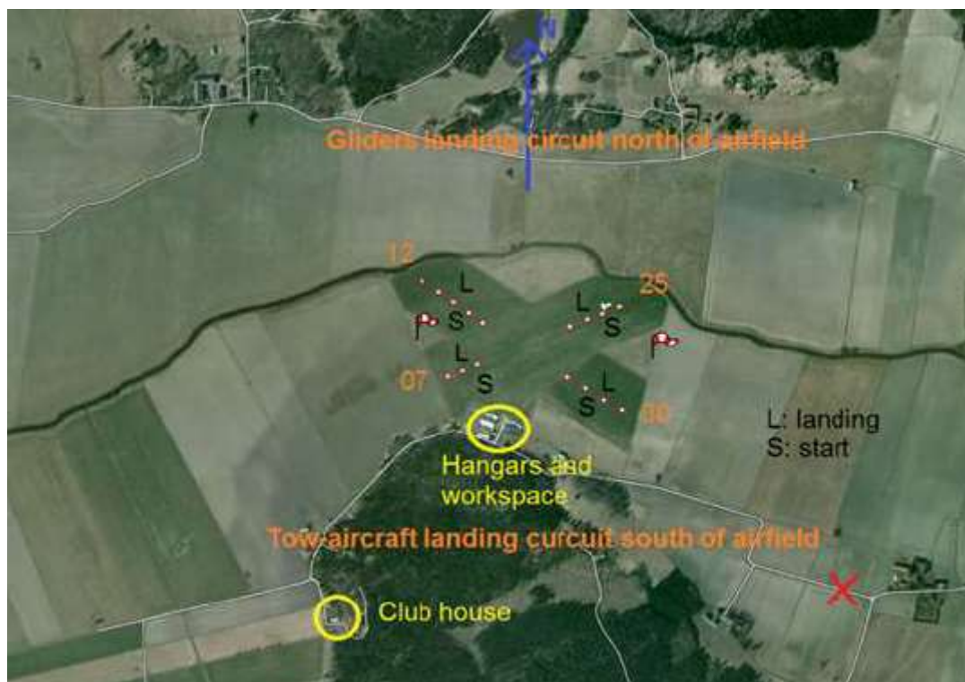
Långtora flygfält, flygfoto

TMG hänvisas till att använda motorn så lite som möjligt i närheten av fältet rent generellt och bullerområdena måste respekteras.